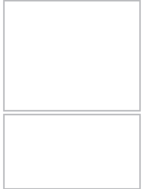
図 22.48 原発性皮膚濾胞中心リンパ腫 (primary cutaneous follicle center lymphoma)

高齢者の下肢に好発するが, 必ずしも下肢に生じるとは限らない。大型で異型性の強い, 濾胞中心芽細胞あるいは免疫芽球様細胞がびまん性に増殖する (図 22.49)。Bcl-2 陽性, MUM-1/IRF4 陽性が重要。予後はやや不良で, 5 年生存率は約 50% である。