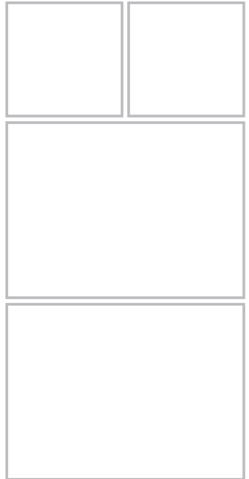
図 22.28 隆起性皮膚線維肉腫（dermatofibrosarcoma protuberans）

弾性硬の比較的境界明瞭な結節が体幹や顔面などに生じる、中間群の腫瘍。病理組織学的には膠原線維の増加する領域と、紡錘形細胞が方向性なく（patternless）増生する領域が観察される。CD34, CD99, Bcl-2 陽性。NAB2-STAT6 融合遺伝子が大部分の例でみられる（p.465 MEMO 参照）。