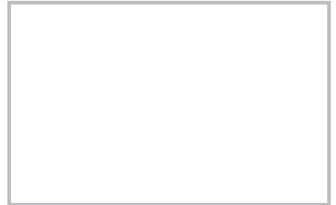
図 21.63 結節性筋膜炎 (nodular fasciitis)