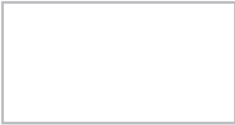
図 21.60 鼻部線維性丘疹 (fibrous papule of the nose)