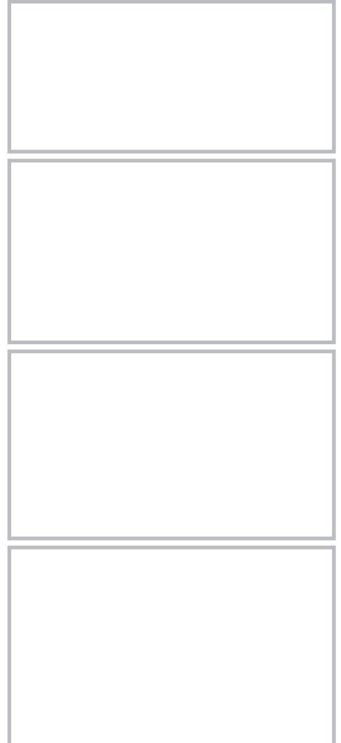
図 21.55 軟性線維腫 (soft fibroma)