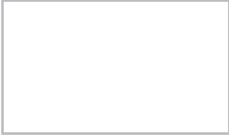
図 21.11 脂腺腫 (sebaceoma) 黄色調のドーム状に隆起する小結節。

し扁平な小結節 (図 21.10)。複数個生じることが多い。中心 さいか 臍窩を有し、ときに中央から皮脂を排出する。