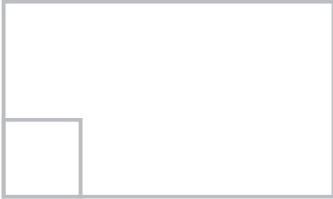
図 21.10 脂腺増殖症 (sebaceous hyperplasia)