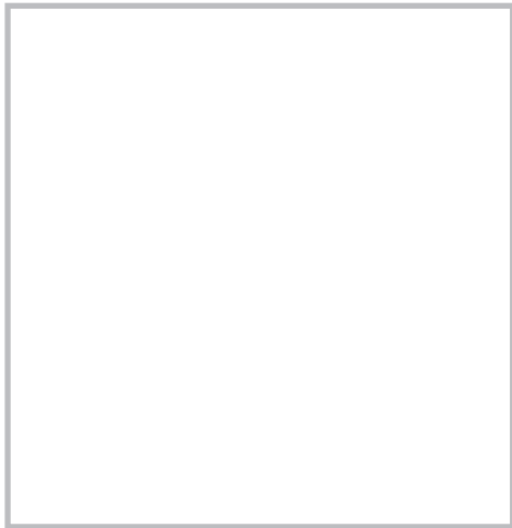
図 20.31 Becker 母斑 (Becker's nevus)