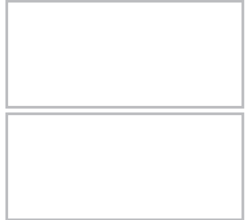
図 17.5 結節性皮膚アミロイドーシス (nodular cutaneous amyloidosis)

60 歳代に好発する。多発性骨髄腫に伴うもの、あるいは形質細胞の形成異常（plasma cell dyscrasia）が原因として考えられている。皮膚病変としては、黄白色調の光沢のある丘疹が眼瞼、顔面や頸部に好発する。軽い刺激により紫斑を伴いやす