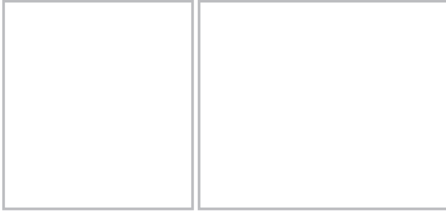
図15.48 鱗状毛包性角化症(土肥) 〔keratosis follicularis squamosa (Dohi)〕