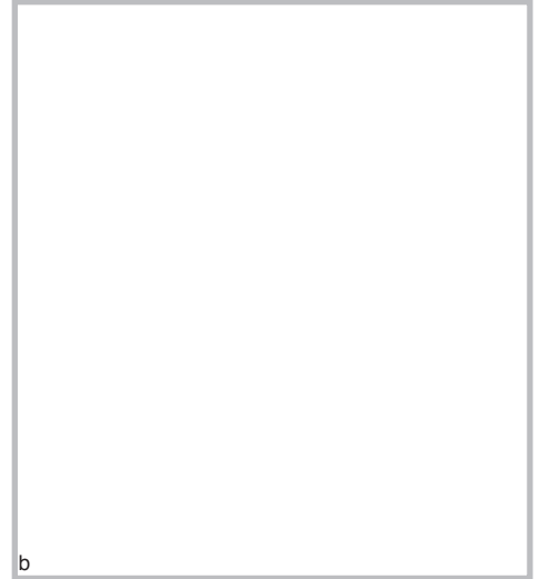
図 12.9 新生児エリテマトーデス（neonatal lupus erythematosus）の環状紅斑 a：0歳男児左側頭部。初め5mm～1cm大の紅斑として生じ、徐々に環状に拡大。中心部は消退傾向を示すが、辺縁部は著明な浮腫と隆起を認める。b：右側頭部に生じた2つの環状紅斑。